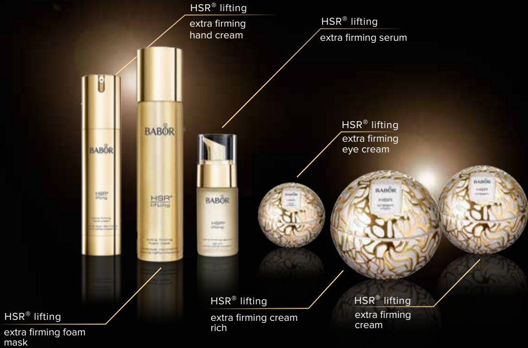
HSR® lifting extra firming hand cream